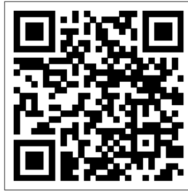
รูป QR Code ดาวน์โหลดแบบ 56-1 One Report